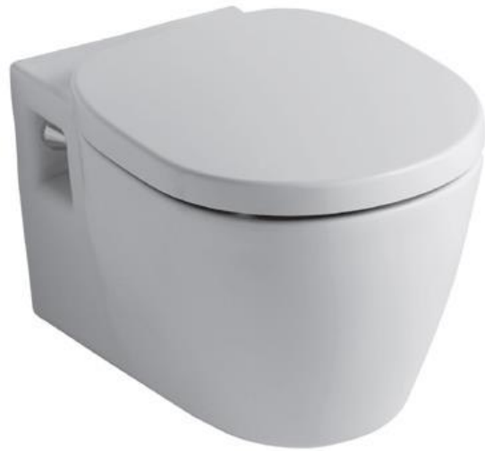
Ideal Standard Wandcloset, diepspoel met duroplast zitting en deksel met RVS scharnieren, wit