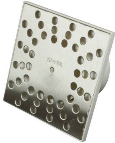
Doucheput met RVS rooster 15 cm x 15 cm