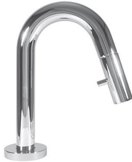
Ideal Standard Koudwaterkraan 6 l/min met hoge uitloop en geïntegreerde bediening in chrom