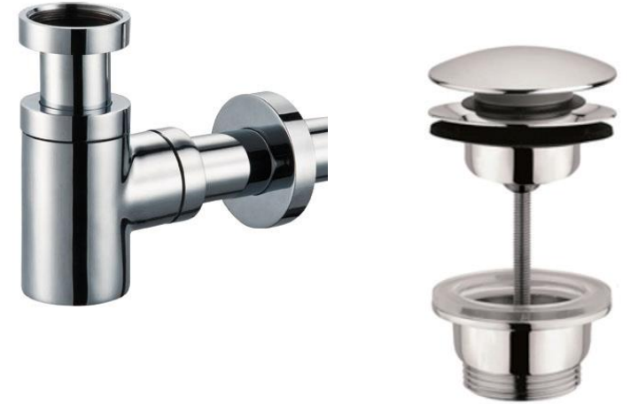
Designbekersifon rond met muurbuis en rozet, chrom en design afvoerplug chrom