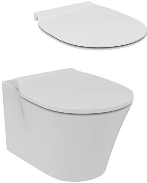
Ideal Standard Wandcloset AquaBlade, diepspoel met met dunne softclosing zitting en deksel met RVS scharnieren, kleur wit