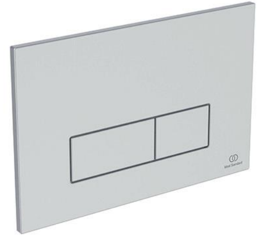
Ideal Standard Bedieningspaneel Oleas M2 mat chroom