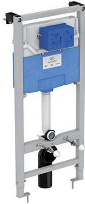
Ideal Standard Inbouwreservoir