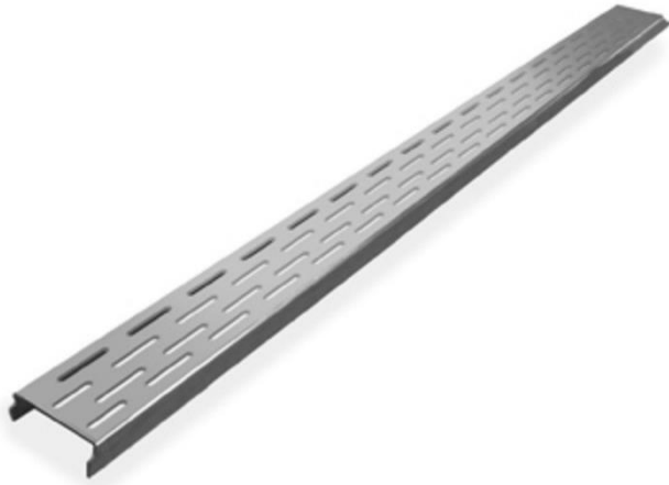
Showerdrain met RVS rooster 68,7 cm